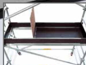
Platformă cu trapa