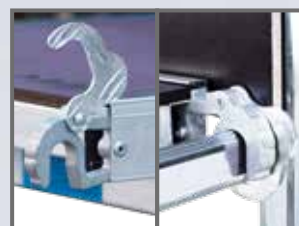
Sistem contravântuire / blocarea platformei de lucru