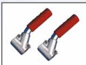
Mânere pentru deplasare (la cerere) cod. A19MAN