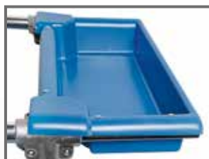
Cutie port obiecte