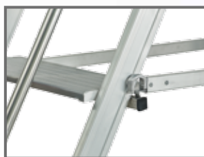
Dispositivo di anti apertura/chiusura