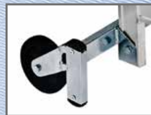
Bara de stabilizare cu roți