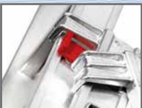
Limitator suprapunere maximă la ultimul tronson