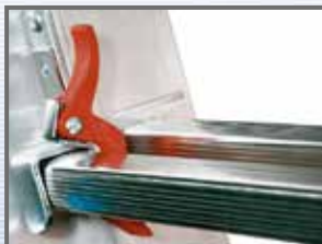
Dispozitiv împotriva desfacerii accidentale

CERTIFICATĂ DE: TUV ITALIA SRL și POLITEHNICA DE STAT din MILANO