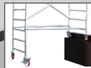
Element pentru denivelare