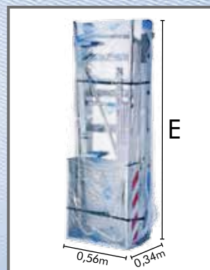
Kit de livrare