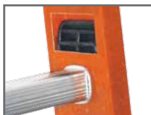
Fixarea treptei pe montant cu întăritura împotriva dezechilibrării